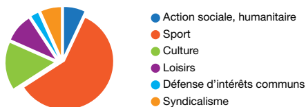
Les domaines d'engagement associatif des 16-24 ans (INSEE, 2008)

En effet, le baromètre "jeunesse" révèle que 72 % des jeunes interrogés seraient prêts à s'investir dans une association culturelle, sportive ou de loisirs. 38 % des jeunes sont effectivement membres d'une association et 85 % des 15-35 ans font confiance aux associations pour que la société évolue "dans le bon sens". Les associations sont perçues comme des "concrétiseurs de l'action", des "opérateurs du changement" à court ou moyen terme. De la même manière, les mouvements sociaux portés par les jeunes ont rarement été aussi nombreux que dans la dernière décennie. Si problème d'engagement il y a, il vient plus du côté de l'offre que du côté de la demande.